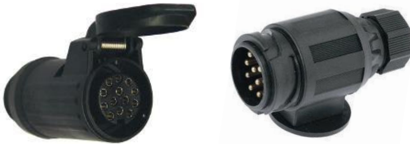
ISO 11446 13 pin