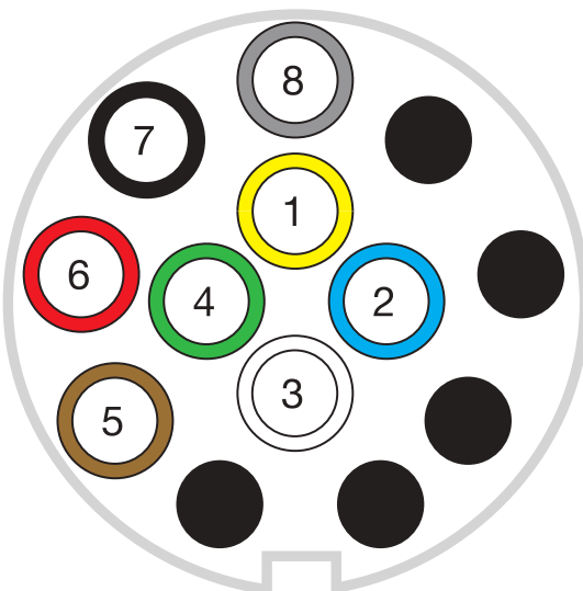
ISO 11446 8 pin